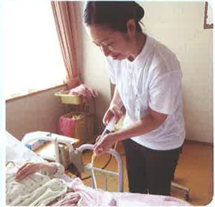
経管栄養半固形介助

今年度は2年生23名が、6グループに分かれて、施設における看護の役割や業務の実際、老年期の利用者とのかかわり方など、看護師としての学びを深めていました。学んだことを今後の実習にも活かし、素敵な看護師になってくださいね。