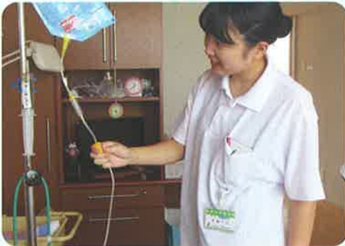
経管栄養滴下介助