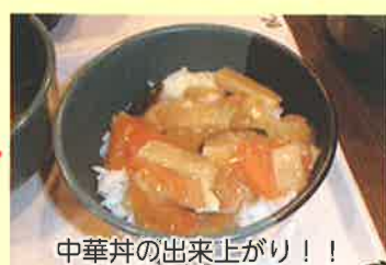
中華丼の出来上がり!!

みずばしょうでは、災害時もスムーズに食事提供できるよう、年に1度非常食提供訓練を行っています。今回の中華丼の具は見た目も味も良く、利用者さんにもご満足いただけようです。ご理解・ご協力ありがとうございます。