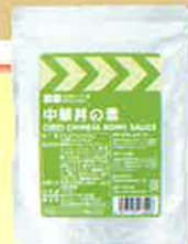
〈非常用中華丼の具〉