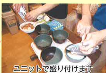
ユニットで盛り付けます