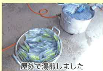
屋外で湯煎しました